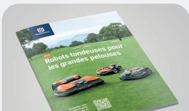
ROBOTS TONDEUSES POUR LES GRANDES PELOUSES

Votre revendeur Husqvarna se fera un plaisir de vous conseiller. Vous trouverez également plus d'informations sur husqvarna.ch > Services