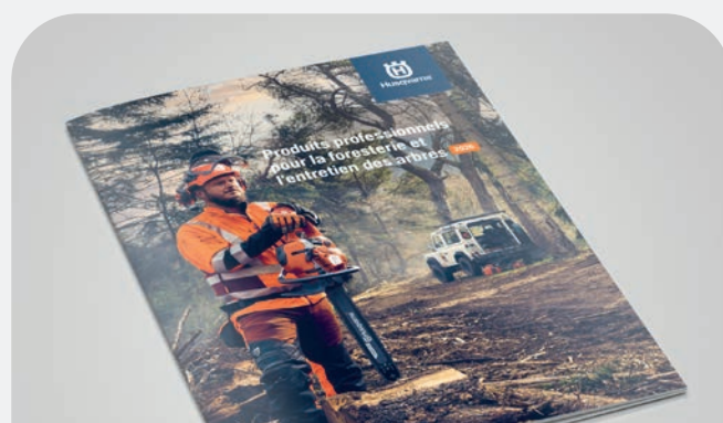
PRODUITS PROFESSIONNELS POUR LA FORESTERIE ET L'ENTRETIEN DES ARBRES (DÈS T2/2026)