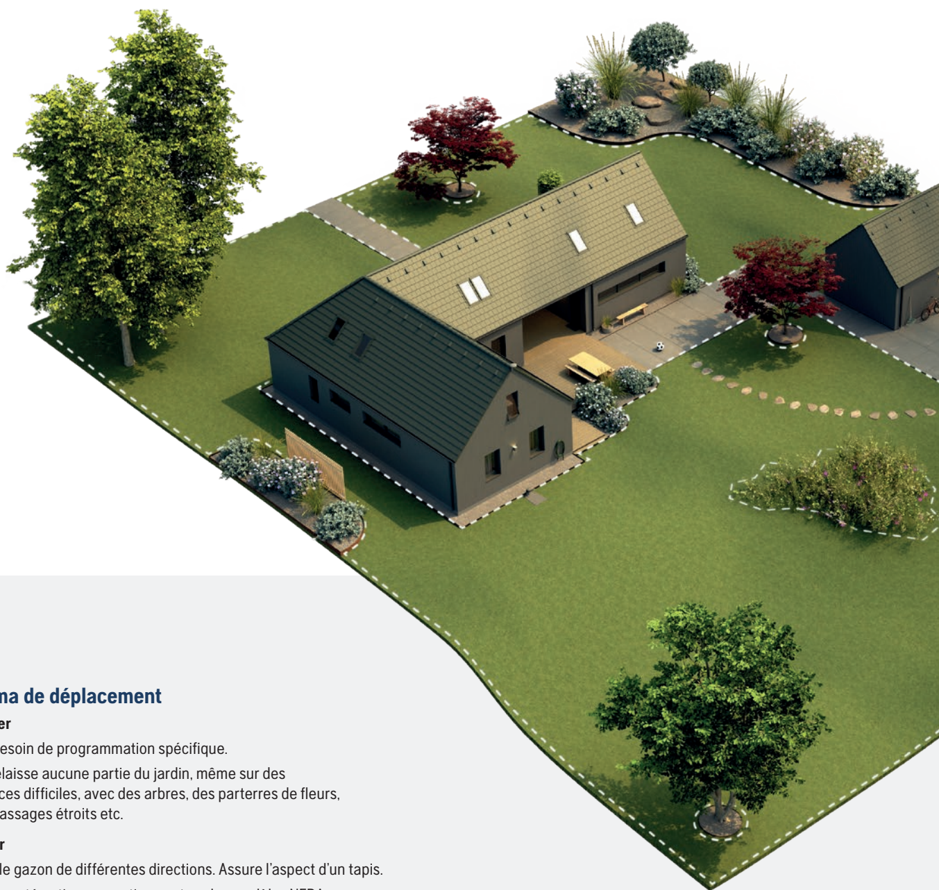
Schéma de déplacement